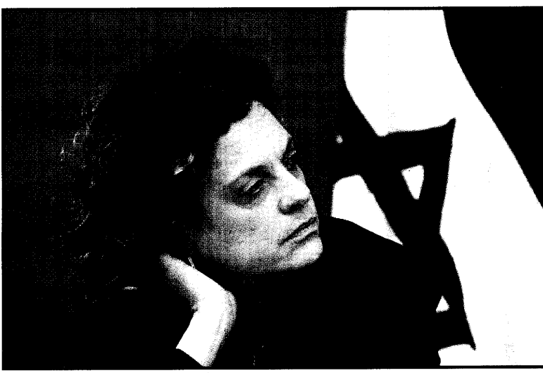
פרופ' יולי תמיר

"אם לא הייתי אופטימית לא הייתי בתפקיד. אבל זה תלוי מאוד במשאבים. התחלנו לטפל בצורה יסודית בצפון. אני מקווה, שמערכת החינוך בצפון תהיה במצב יותר טוב ממה שהיא היום. אנתנו מתחילים לטפל בבתי ספר שונים, בהתאם לצרכים שלהם וכבר רואים שמנהלים ומורים, במקומות הכי גרועים, לוקחים אחריות. אבל לצורך כך צריכים תמיכה של המערכת. באשר לסטודנטים אנתנו בהחלט הולכים לכיוון שבו ניתן את היכולת ללמוד לכלל הסטודנטים, כך שהסטודנטים יקבלו הלואות לתשלום שכר לימוד אותן הם יחזירו בתום לימודיהם. יש לי תמיכה מסיבית מראש הממשלה לנושא, ואם נעבוד נכון זה יקרה ואז יהיו יותר משאבים למחקר".